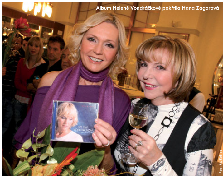
Album Heleně Vondráčkové pokřtila Hana Zagorová

z tváře padá a Zpívám své zpívání jsou z pohádek, ta první konkrétně z filmu Sílene smutná princezna. Touhle rolí se mi splnil dětský sen. Moc ráda na to vzpomínám. Pohádky mám ostatně pořád moc ráda. Těším se na to, že až budeme s manželem doma strojit vánoční stromeček, pustíme si v televizi nějaké pěkné pohádky. Ještě před tím ale odzpívám vánoční kon-